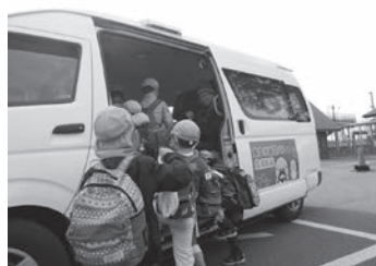
市内循環バスを利用する園児たち