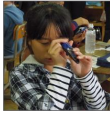
糖度計での計測は真剣そのもの

その実績が認められ「平成27年度千葉県学校健康教育」の「学校給食部門」で『優良学校』の栄誉に輝きました。今後とも給食を通して健康教育を意識した食育指導のより一層の推進を図ります。