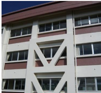
校舎ブレース(筋交い)や耐震壁により補強された城西小学校

※その他、幼稚園、小中学校の大便器の洋式化と合わせて、明るくきれいなトイレへの改修工事も進めています。