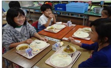
身体に優しい豊産豊食による健康給食