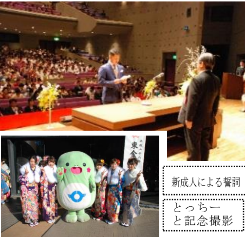
新成人による誓詞

中学校の恩師にもご出席いただき、久しぶりに先生と生徒とのひと時を過ごしたようです。