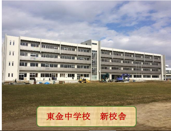
東金中学校 新校舎