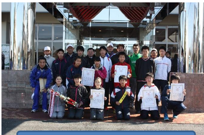
準優勝を果たした東金市選手団

平成28年2月11日(祝・木)に、第46回山武郡市民駅伝競走大会が、山武市蓮沼スポーツプラザをスタート・ゴール地点とする山武市蓮沼内周回コースにて開催されました。 冬晴れの中、郡内3市3町の代表選手が熱戦を繰り広げ、東金市は前半コース2位、後半コース2位、総合部門で準優勝を獲得することができました。3連覇は逃したものの、選手たちの力強い走りに大変感動させられました。