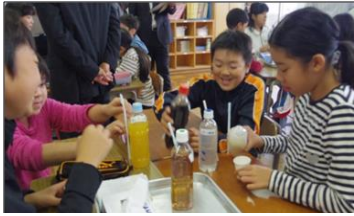
普段口にする清涼飲料水の糖分含有量の検証

そして、平成27年6月24日に開催された「食に関する指導事業・地区別研究協議会」において、山武・長生・夷隅地区の代表として研究の成果を発表しました。