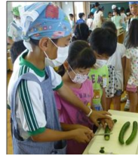
全校で取り組んだ食育学習の様子

その実績が認められ「平成27年度千葉県学校健康教育」の「学校給食部門」で『優良学校』の栄誉に輝きました。今後とも給食を通して健康教育を意識した食育指導のより一層の推進を図ります。