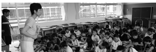
小学5・6年生への英語授業が今年度からスタート