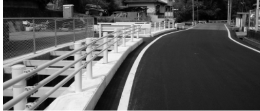
整備が進む「小野川」の改修工事

では、集中豪雨等による道路冠水等の浸水被害の解消のため、順次整備を進めていることと思われるが、財政状況が厳しい中、排水路整備の現状と今後市としてどのよう整備を進めていくのか伺いたい。