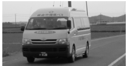
豊成地区で運行されている「循環バス」

答 新学習指導要領 の主な改善点は6つ あり、思考力、判断 力、表現力を育むた めの言語活動の充実、 国語活動の充実など が掲げられている。 授業時数では、小学 校では5・6年生に 外国語活動が新たに 取り入れられ、全体 時数が増加するが、 総合的な学習時間の 縮減により週当たり 1時間の増加となる。