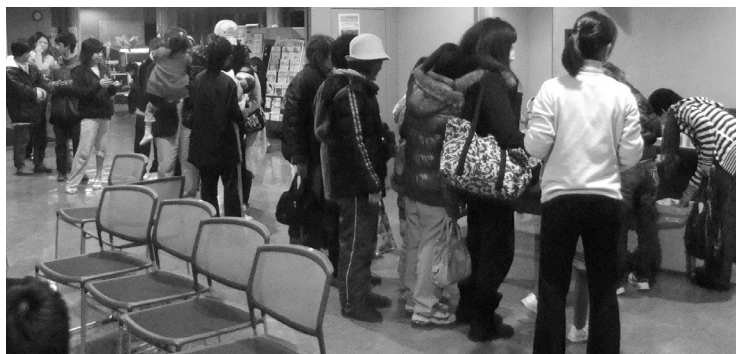
3月11日、約600名を超える住民が避難した「東金市ふれあいセンター」