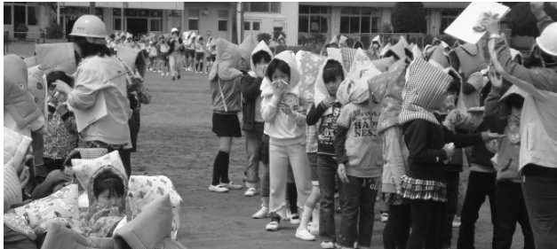
城西小学校で行われた防災訓練

われている学校安全保険法に基く安全点検の実施状況は、また、この4月に国からの非構造部材の点検に関する通知があったと思うが対応状況は。 答 安全点検については、児童生徒が通常使用する施設及び