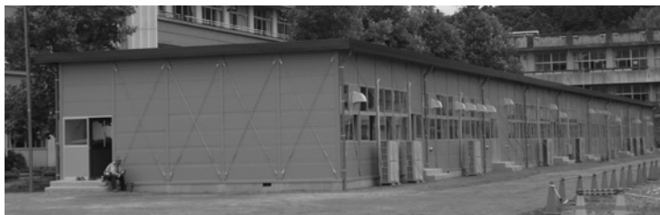
城西小学校校舎改築に向けプレハブ校舎が完成

【第1号議案】 平成24年5月25日付けで、「東千葉メディアセンター建設の是非を問う住民投票条例」の制定 (原案可決・賛成多数)