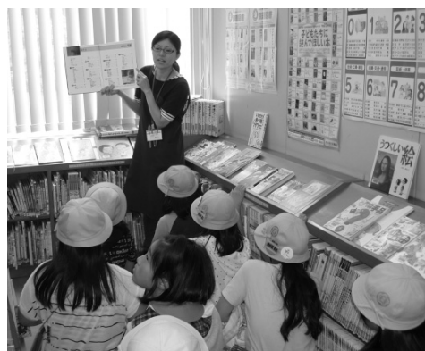
城西小6年生が東金図書館で職場体験

問 通学路として指定されている道路には、危険な状態の道路も多い状況にあるため、児童・生徒の安全・安心の確保のために、優先的な予算配分を行い改善を図るべきと考えられているか。また、菱沼から豊成小学校までの通学路は、要望書等も提出されたが、今後の改善方針は。 答 通学路は、毎年各学校長が定め、要注意箇所等も併せて調査したものをもとに、委員会等と協議し、市長部局へ報告しており、それを各担当