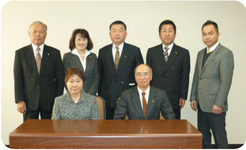
所管事項について審査をする文教厚生常任委員会

地方自治法及び東金市議会委員会条例に基づいて、市議会に三常任委員会と議事運営委員会を設置しています。各常任委員会は、その委員に属する市の業務に関する調査を行い、議案・請願・陳情等を審査します。また、議事運営委員会は、議会の円滑かつ効率的に進行させる役割を果たしています。各委員の任期は二年です。