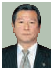
【東金市長】 志賀 直温 Naoharu Shiga, Mayor