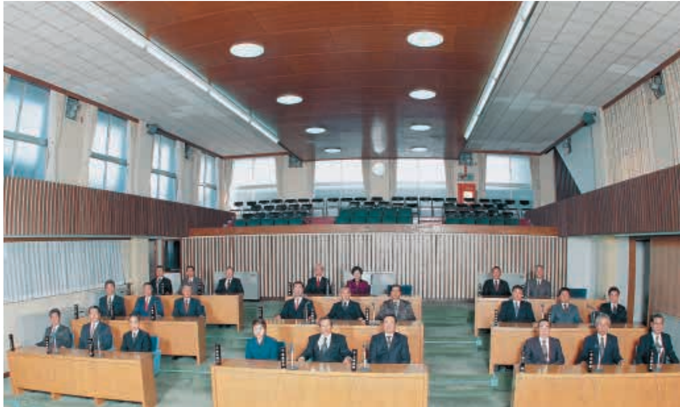
市議会 The city council