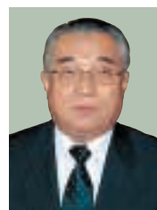
【助役】 濱邊 治雄 Haruo Hamabe, Deputy Mayor