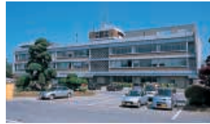
市庁舎 Togane City Hall