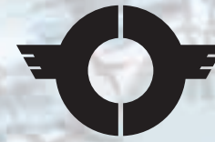
市章 City Emblem