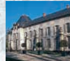
姉妹都市◎リュエイユ・マルメゾン市(フランス) Sister City / Rueil-Malmaison, France