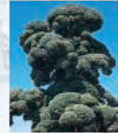
市の木◎ラカンマキ City Tree / Rakan-maki